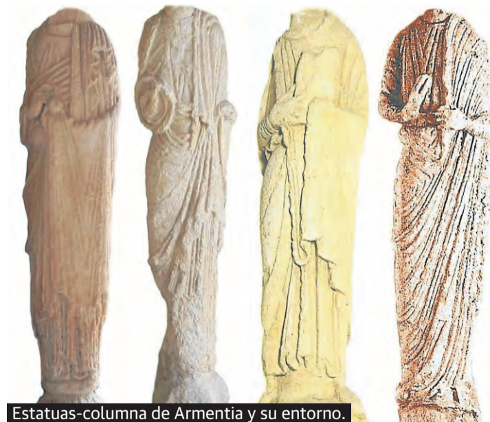
Estatuas-columna de Armentia y su entorno.

dero, se pueden contemplar dos Cristos. El de mayor tamaño, ubicado en el 'Tímpano de los Apóstoles', y el más pequeño, en el relieve de la Anastasis o de la 'bajada de Cristo a los infiernos'. Son dos altorrelieves relacionados estilísticamente que presentan idénticos adornos y que si no están hechos por la misma persona,