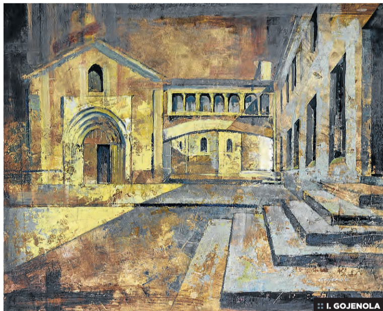
:: I. GOJENOLA

na. «Me decanté por el acrílico porque permite realizar modificaciones mientras continuas trabajando», explica el último ganador. Largas horas delante del lienzo hasta que consiguió el resultado deseado. «Me impregné de todo antes de dibujar, porque si calcas, al cuadro le faltará vida», desliza Fernández.