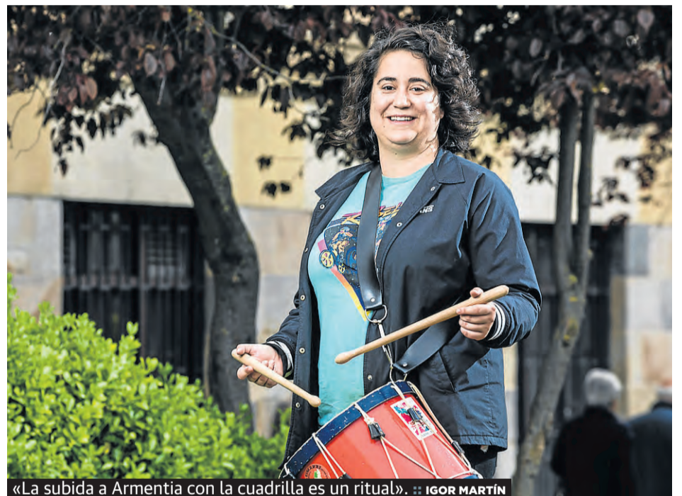
«La subida a Armentia con la cuadrilla es un ritual».