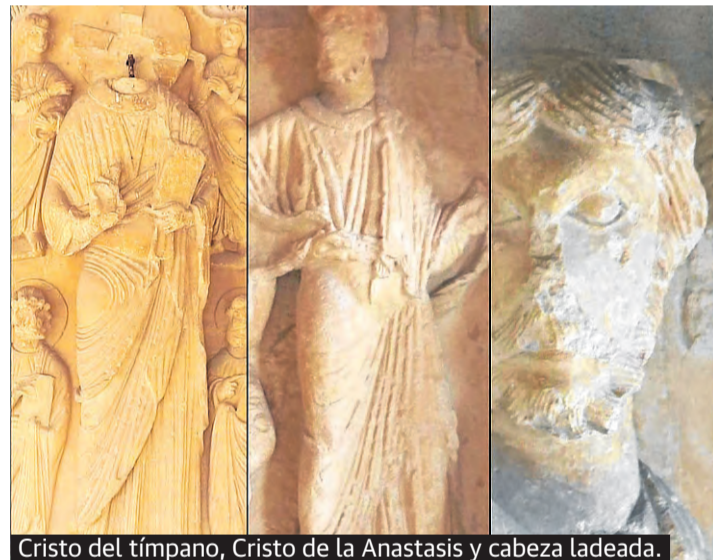
Cristo del tímpano, Cristo de la Anastasis y cabeza ladeada.