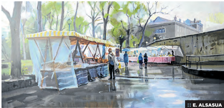
:: E. ALSASUA