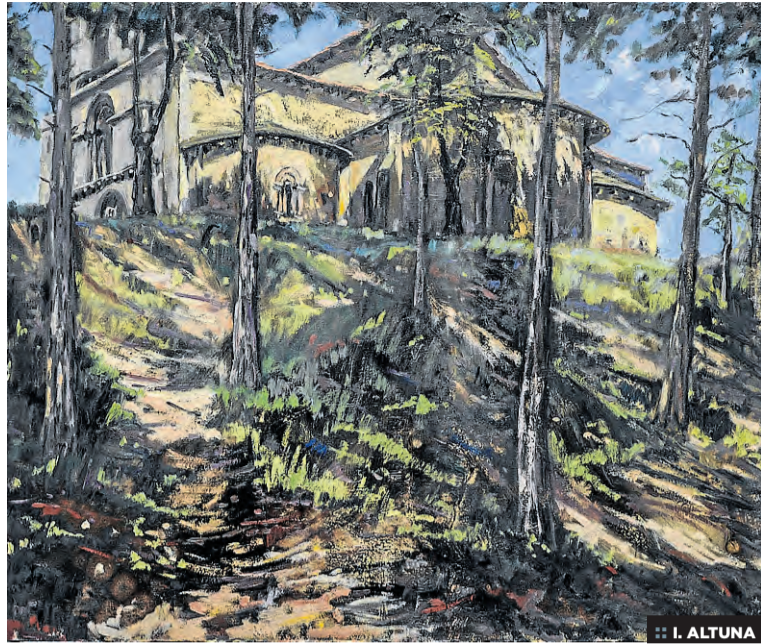
:: I. ALTUNA