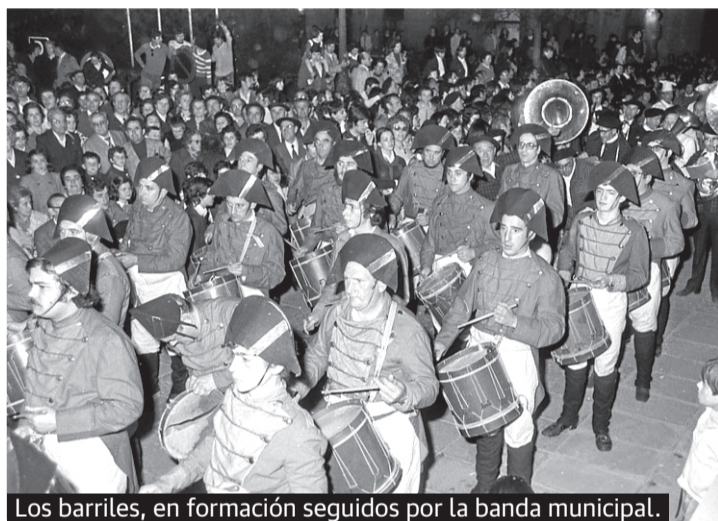
Los barriles, en formación seguidos por la banda municipal.

► El repertorio musical. Cinco melodías: Retreta, 'Las tres de la madrugada', 'El Bala', Tamborrada vitoriana y Geuria da. Posteriormente, con los años, se fue completando el cancionero con más piezas alavesas.