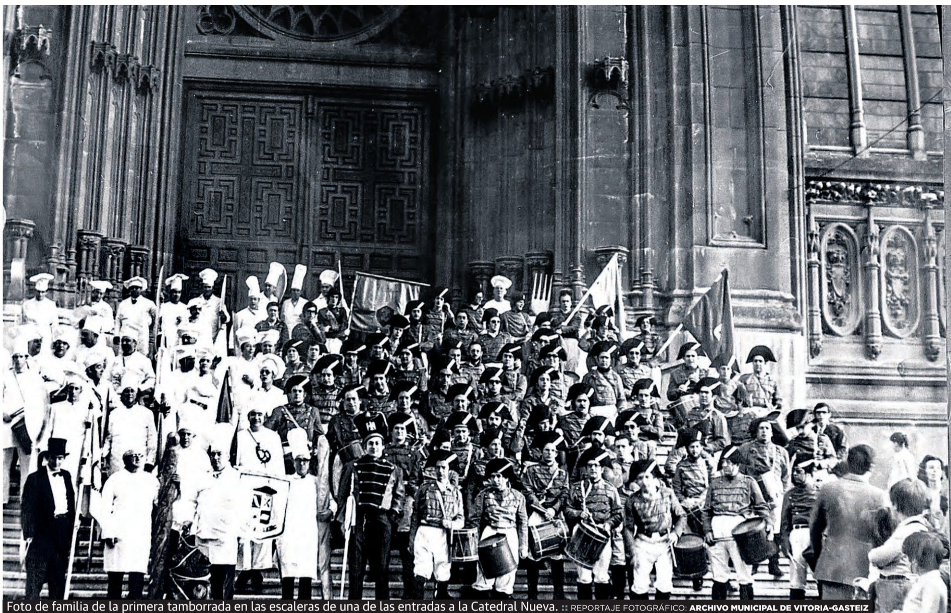
Foto de familia de la primera tamborrada en las escaleras de una de las entradas a la Catedral Nueva.